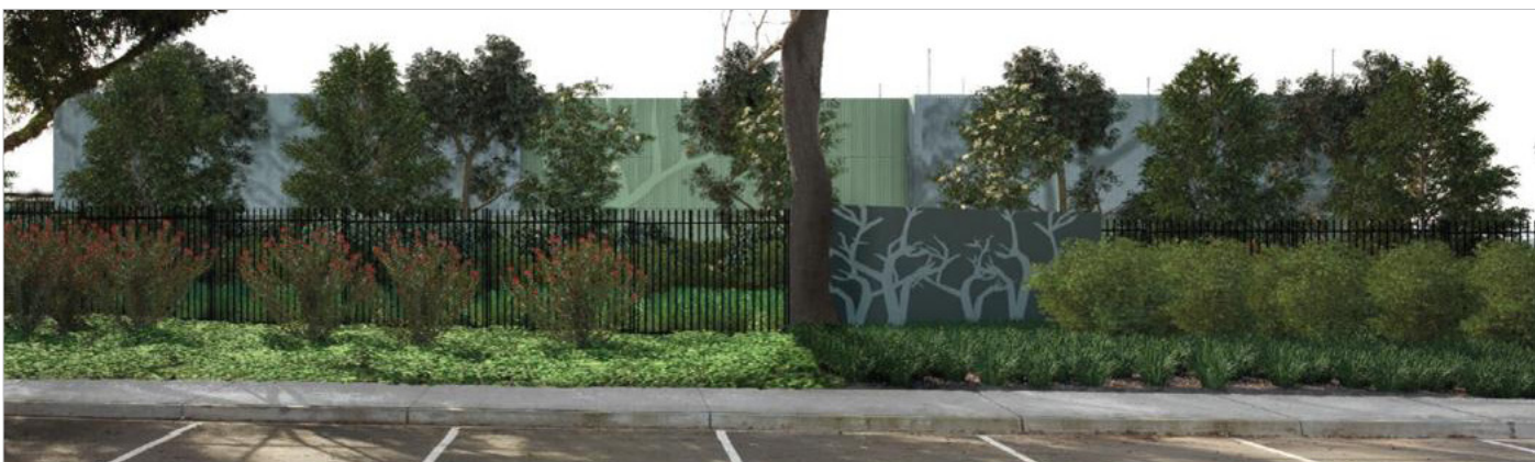
Καλλιτεχνική απεικόνιση του Τερματικού Σταθμού στο Brunswick